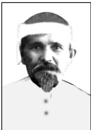
Именкең ата-жұртын жиі аралайтын. Отызыншы жылдардан бұрын дүниеден өтіп кеткен, басында белгісі жоқ туысқандарына көктап қойып жүретін еді. Бір жылы тау ішіне бойлай кірдік. Намаз уақыты келген. Дәретін алып, қалың ағаштың ішіне молы-

Ол кісінің күндізгі жұртқа үлгі амал, түні намаз екенін айтқан жөн. Қолынан түспейтін кітабы Құран Көрім. Түннің бір уағына дейін соны оқып, Алладан кешірім сұрайтын. Құран парақтарын соншама тез оқитыны сондай, оны жатқа білетіндей көрінетін. Намаз оқыған кезде рухын тынықтыратын. Намаздың барлық рәсімдерін бар ынтымақпен орындап, әр аятты беріле оқитыны ерекше көрінетін еді. Сол бір сәтте бүкіл болмысы елжіреп, босап, дұғамен рухтанып отыратынына біздің де көңіліміз сенетін.