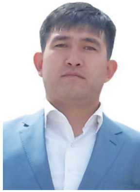
Құрметті Бағлан Мейрамұлы!

Сізді 6-шы наурыз күні 33 жасқа толатын туған күніңізбен құттықтаймыз.